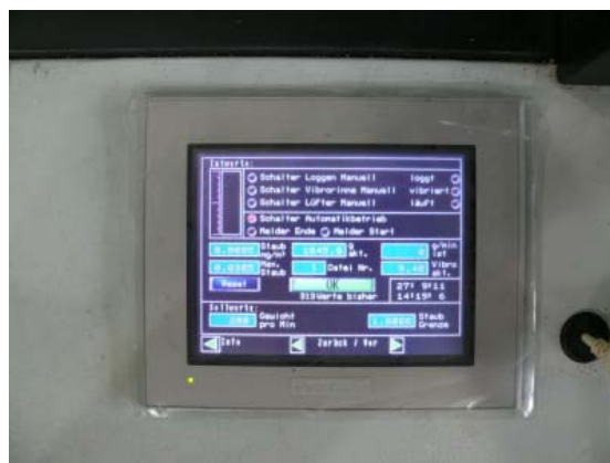
Abb. 5: Über das Touch-Screen-Display lassen sich alle erforderlichen Parameter direkt eingeben.

Waage: Elektronische Wägezelle mit Plattenmaß für Probenbehälter: 240 mm Breite und 300 mm Länge.