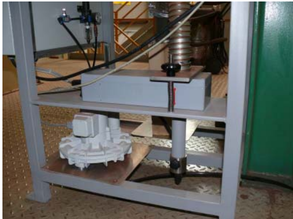
Abb. 2: Das Radialgebläse saugt die mit Staub beladene Luft durch das Photometer

Messeinrichtung bestehend aus einem Vorratsbehälter für die zu prüfende Probe, Vibrationsrinne, drehzahlregelbarem Radialgebläse, Photometer und Schaltkasten mit Touch-Screen in einem Rahmen aus Quadratprofilrohren.