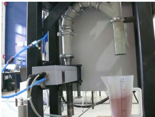
Abb. 3: Das Saatgut landet im Auffangbehälter.

Über den Saatgutvorratsbehälter mit Niveauschalter (leer / voll) gelangt die Saatgutprobe über eine in der Geschwindigkeit regelbare Vibrationsrinne in ein Fallrohr. Am Ende des Fallrohres kann die Saatgutprobe in einem entsprechenden Gefäß aufgefangen werden. Der Saatgutzufluss wird über eine Waage unterhalb des Fallrohres in Abständen von 3 Sekunden erfasst und entsprechend dem zuvor