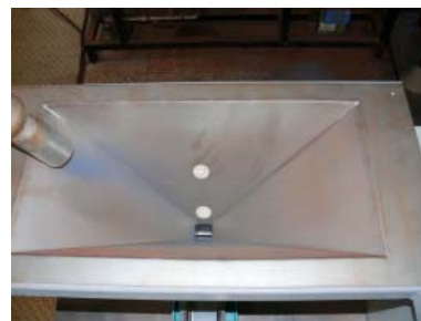
Abb. 4: Der Saatguttrichter ist mit Niveauschaltern für „Leer“ und „Voll“ versehen.

eingestellten Wert (üblich sind Werte zwischen 200 und 500 g/min) überprüft und bei Bedarf automatisch nachgeregelt. Ein von einem Radialgebläse erzeugter Luftstrom führt den in der